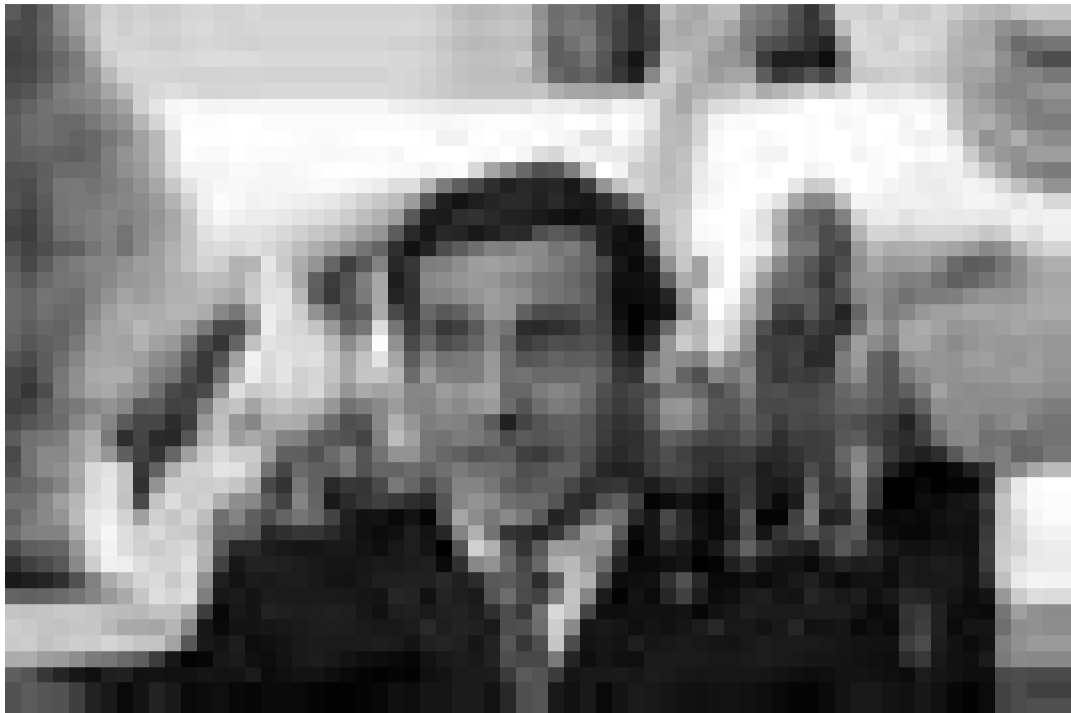
Saint-François d'Assise aurait fait mieux: Steve Allen et ses animaux bénis dans "Evan Almighty", nouveau à l'Utopolis.