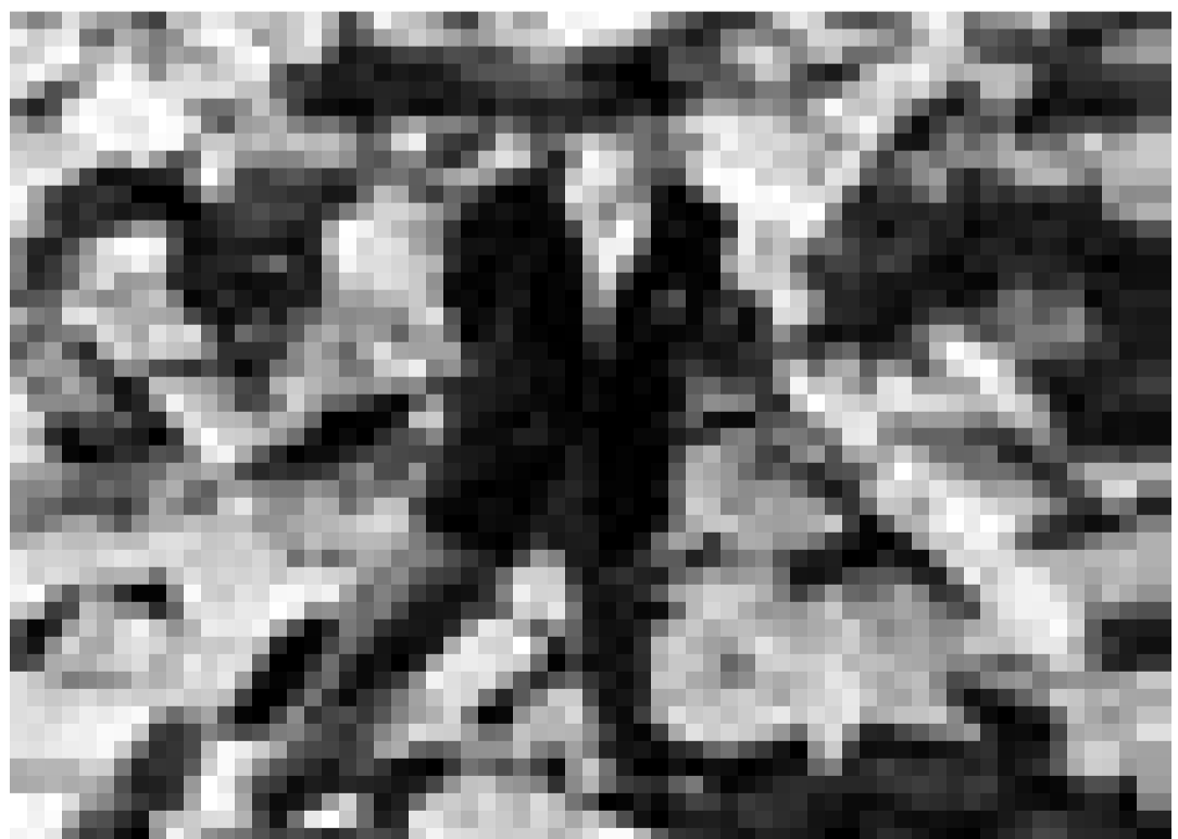
Un autre classique inoubliable, qui fût un des premiers succès d'une carrière exemplaire: Orson Welles dans "Citizen Kane", vendredi à la Cinémathèque.

"Bird" mêle intimement l'homme et le musicien dans ce portrait de Charlie Parker qui alterne, sur un montage en flashback, quelques-uns des moments les plus marquants de sa vie, sa triple passion pour les femmes, l'alcool et la drogue, son amour pour Chan Richardson, la mort de sa fille, l'amitié de Dizzy Gillespie et celle de Red Rodney, ses débuts, ses triomphes et ses échecs, jusqu'à sa mort misérable.