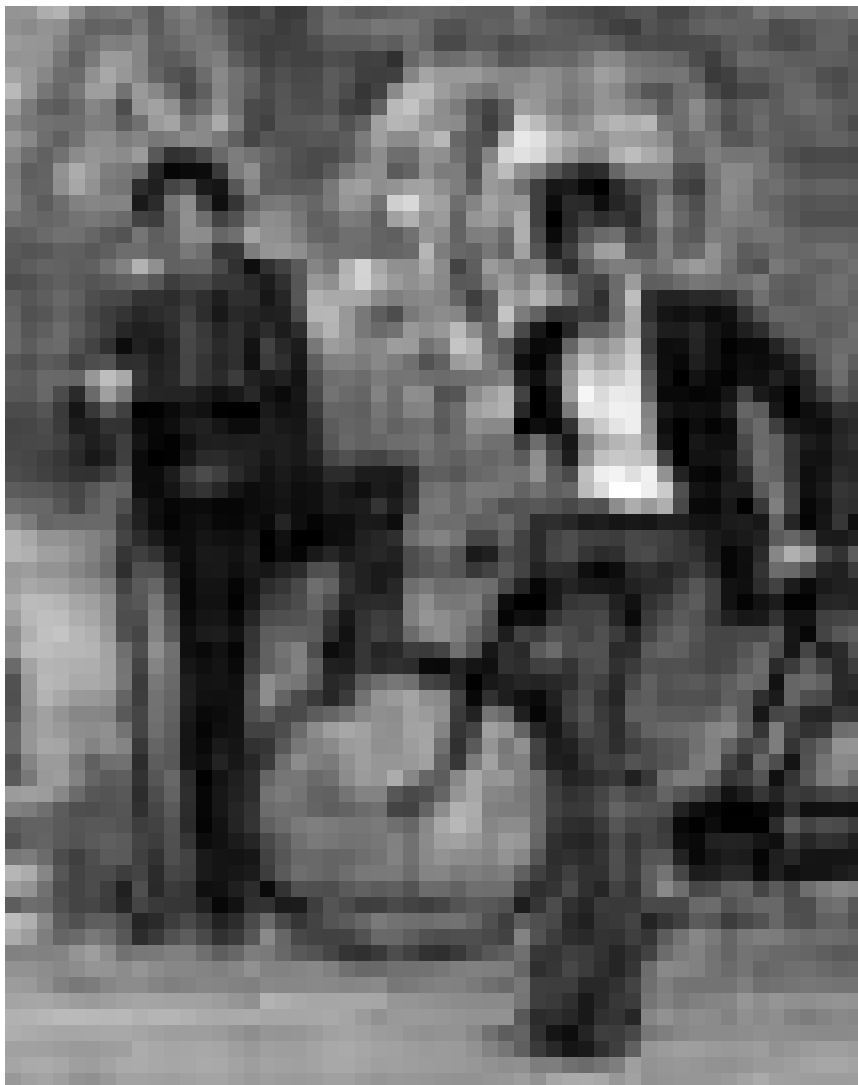
Deux frères opposés. Elio Germano et Ricardo Scamario dans „Mio fratello è figlio unico“ von Daniel Luchetti, nouveau à l'Utopia.