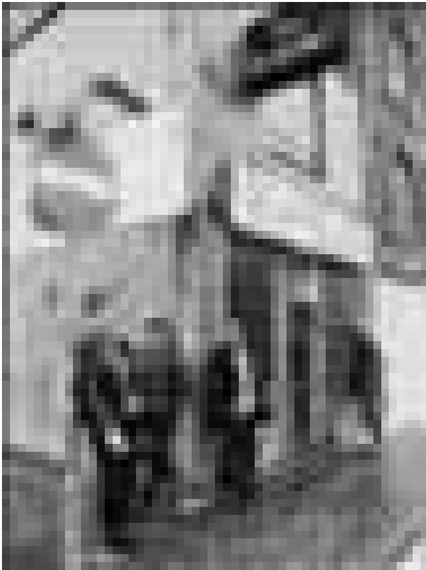
Damals sahen sie noch wild aus: Cover der Erfolgplatte „Try to be Mensch“.