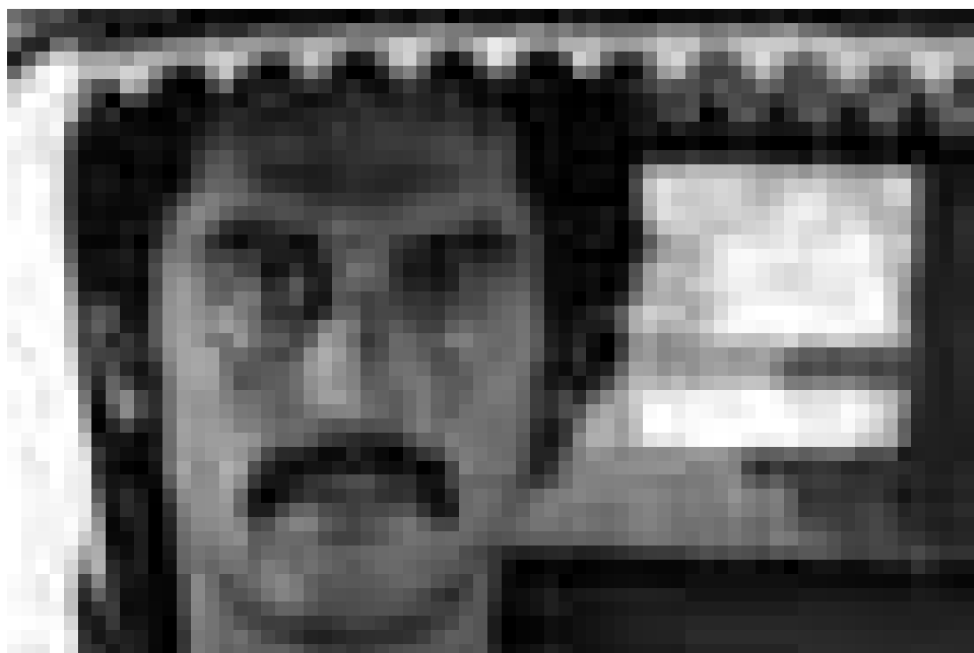
Le premier repenti de la Mafia portraité par Stefano Incerti dans « Il uomo di vetro ». A l'Hôtel de Ville de Villerupt.

Des débats, des expositions et des séances décentralisées en Lorraine et au Luxembourg (Kinosch, Utopia et Cinémathèque) représenteront les points forts du festival. Et outre les nombreuses rétrospectives, le cinéma italien contemporain sera aussi à l'honneur, avec même quelques surprises et avant-premières.