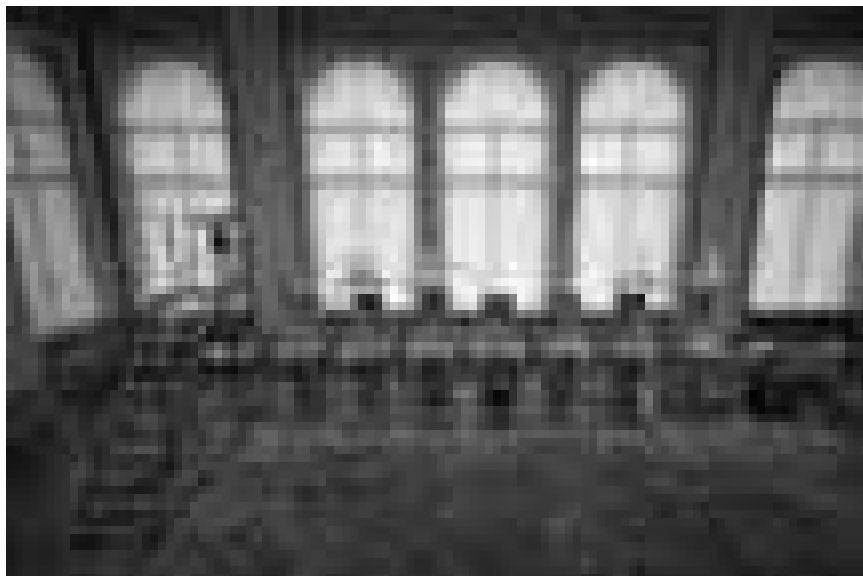
4. Wat sinn am Détail déi global Käschte vun der ganzer Operatioun "Schäissmaschinn" fir de geplote Steierzueler?"