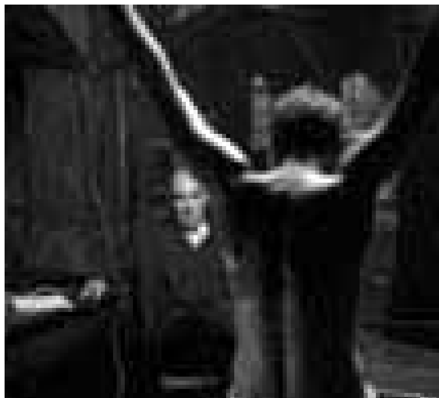
Folterung Terrorverdächtiger. Alan Arkin in „Rendition“. Neu im Utopolis.