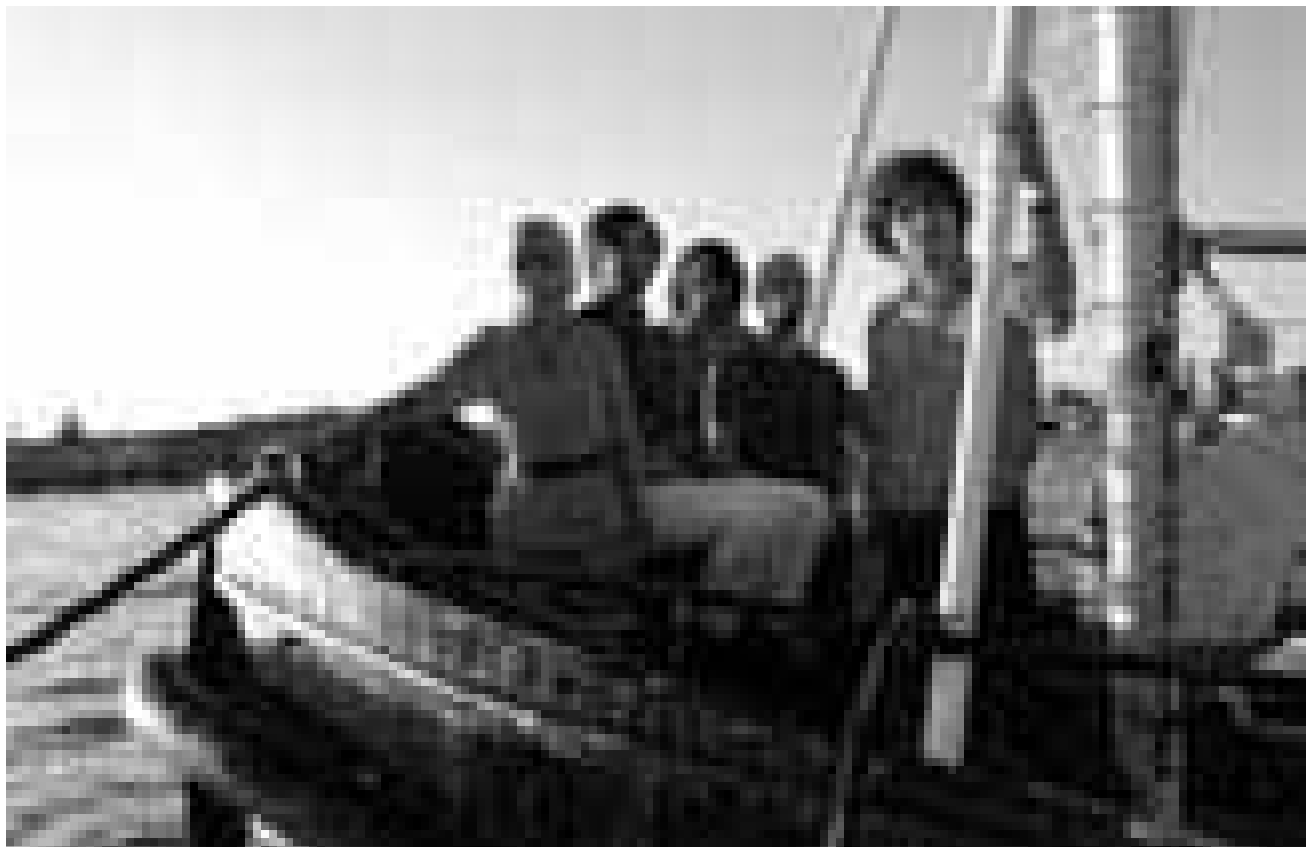
Rebellische Schweden erobern Luxemburg: Die Popband Shout Out Louds stellt ihre neue CD am 30. Januar im hauptstädtischen Atelier vor.

Modeste Proposition , d'après le tract de J. Swift, par la Cie théâtrale L'Escabelle, Centre culturel « La Passerelle », Florange (F) , 20h30. Tél. 0033 3 82 59 17 99.