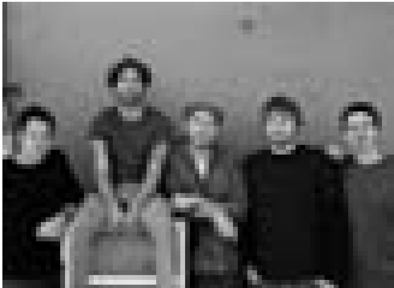
Explosive Mischung die nicht im Einheitsbrei zu versinken droht: Dafür liefert die amerikanische Band „Mad Caddies“ den Beweis am 2. März in der Escher Kulturfabrik.

Salto natale , tierfreier Zirkus, Glacis, Luxembourg, 20h. Tel. 47 08 95-1.