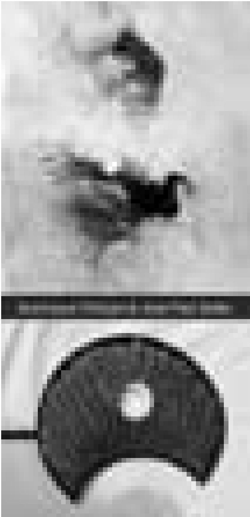
Exposit pour la première fois au Luxembourg : les deux artistes belges à la Galerie bei der Kierch à Kehlen.