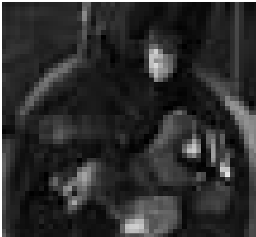
Mise en image des 42 articles de la Convention des Nations Unies pour les Droits de l'enfant par six jeunes photographes. Encore jusqu'au 24 avril au Mierscher Kulturhaus.