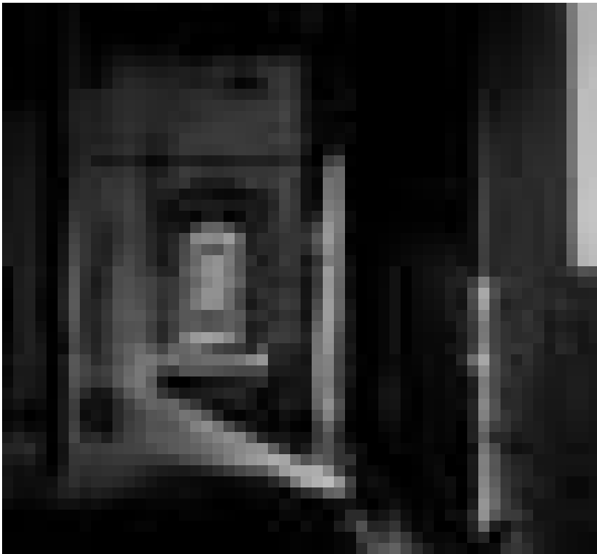
La Galerie d'Art Lucien Schweitzer expose les photographies parfois surréalistes d'Andrej Pirrwitz jusqu'au 30 avril.