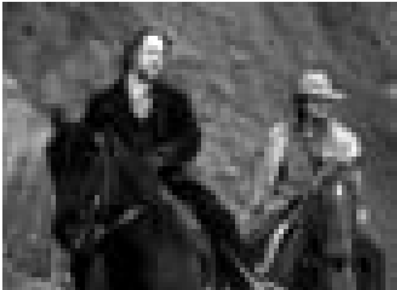
Ein Western mit philosophischen Ansätzen. Russell Crowe und Christian Bale „3:10 to Yuma“. Neu im Utopolis.

Der Dokumentarfilm umspannt fünf dunkle Jahre in der Geschichte des Großherzogtums. Die „schwierige, aber notwendige Entscheidung“ des Exils, aus dem Großherzogin Charlotte