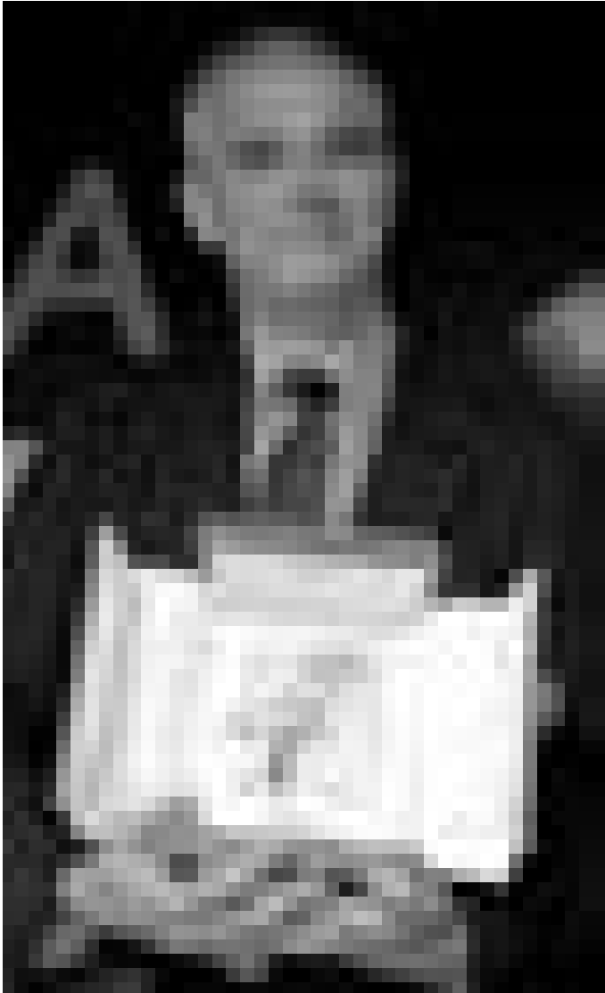
La surprise de Cannes 2008: Laurent Cantet