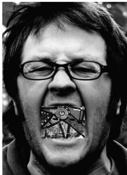
Our pure inception of being leaves us as a blank canvas, naked and alone before the ensuing colours of our future

„In der Tat ist es schwer sich von der Faszination des kontroversen Zusammenspiels von Sex, Tod und Schönheit zu lösen, das die Fotos von Araki evozieren.“ (cw)