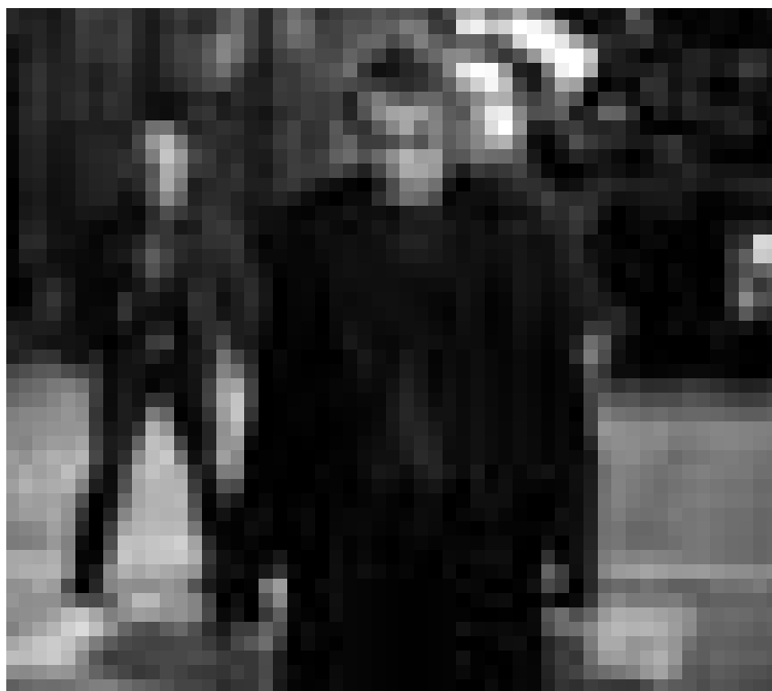
Hat ein kriminelles Superhirn und wird Joker genannt: Heath Ledger in „The Dark Knight“. Neu im Utopolis (Luxemburg) und im Kursaal (Rümelingen).