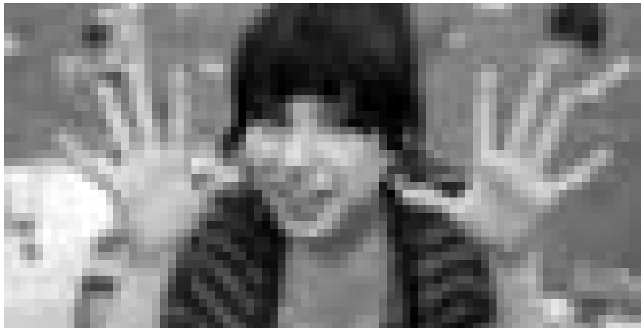
Poppy ist eine Frohnatur. Sally Hawkins in „Happy Go Lucky“. Neu im Utopia.