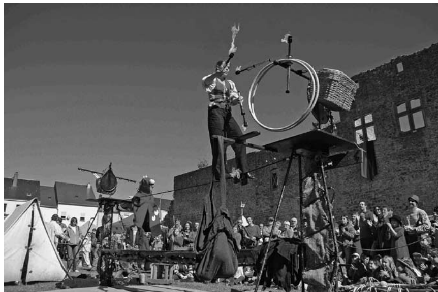
Lagerdorf vor den mächtigen Gemäuern der alten Wasserburg: Am 21. September findet die 5. Ausgabe des Koericher Mittelaltermarkts statt.

Classical & Jazz By One Voice , oeuvres de Duke Ellington à Benjamin