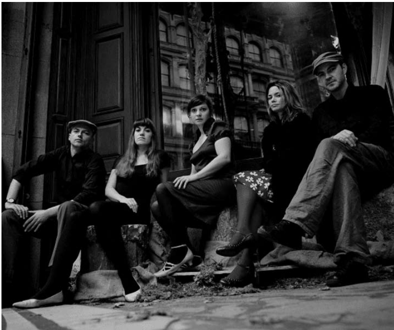
Le highlight de Strassen en 2008 : Nouvelle Vague.