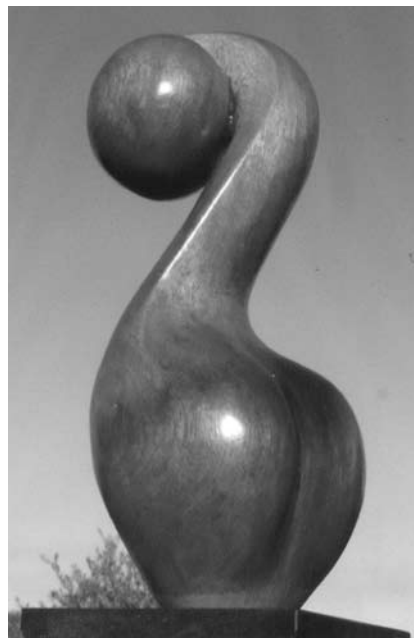
Les sculptures de Pierre Renard sont visibles à la galerie Recto-Verso de Rodange, jusqu'au 19 octobre.

regard historique sur des enjeux d'actualité, Fourneau Saint-Michel (Musée de la vie rurale en Wallonie, tél. 0032 84 21 08 90), jusqu'au 30.11, ma. - di. 10h - 17h.