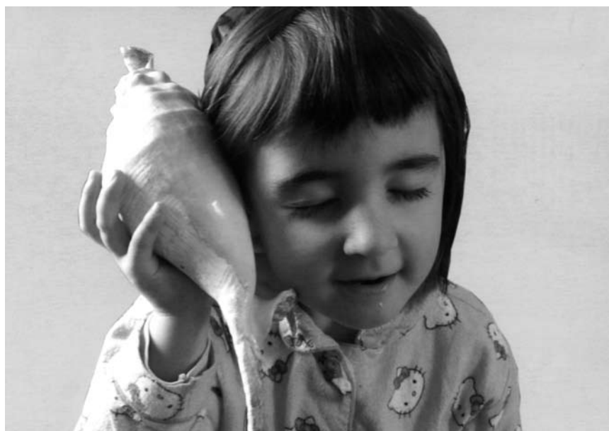
La sphère privée est au centre des photographies de Myriam Hornard. A la galerie Dominique Lang à Dudelange, jusqu'au 31 octobre.