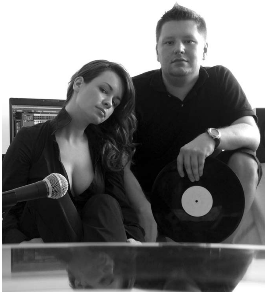
Verkaufen harten Stoff mit fetten Beats: Die Audiodealers sind zu Gast im d:qliq am 26. September und im Ancien Cinéma in Vianden am 27. September.

Vom Grafensitz zur Europastadt , Musée d'Histoire de la Ville, Luxembourg, 16h. Tél. 47 96-45 70.