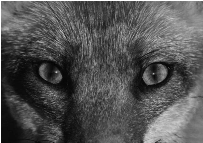
Die Natur ist beschaulich, auch wenn sie uns anschaut ... Die Fotos der Naturfoto-Frënn Lëtzebuerg, noch bis zum 19. Oktober im Merscher Kulturhaus.