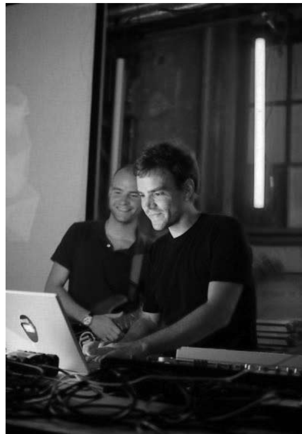
Deux frères, un groove...

Récital de violon et piano , par Vadim Repin et Itamar Golan, oeuvres de Debussy, Stravinsky et Beethoven,