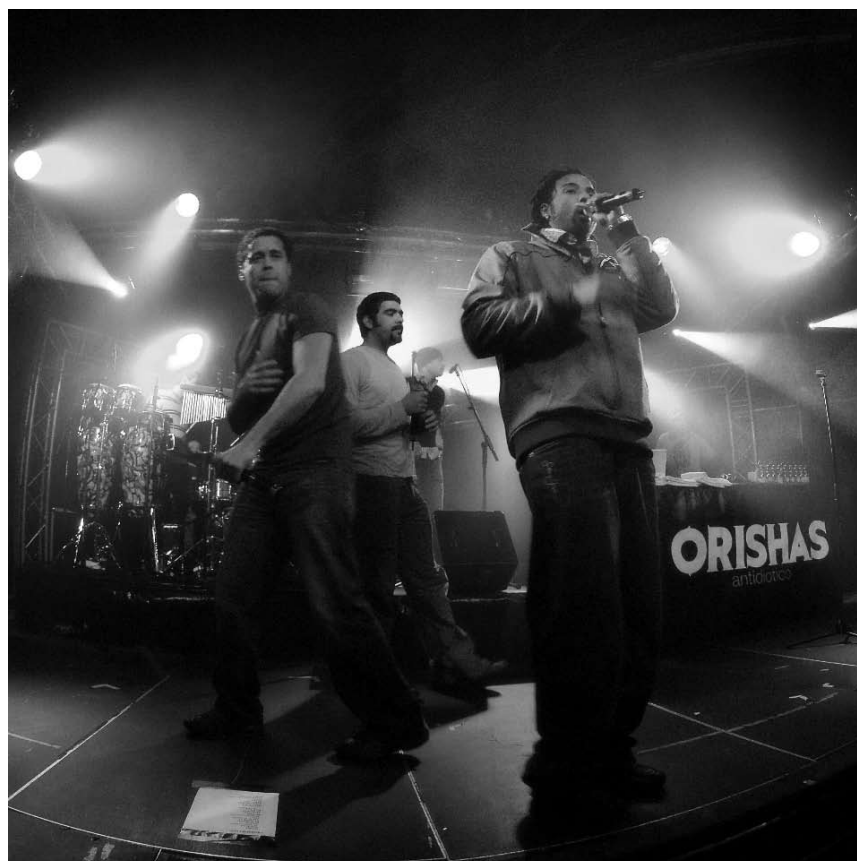
Avec le rythme typiquement cubain qui a fait leur succès, Orishas remettront le feu aux poudres à l'Atelier le 14 octobre.

Vous voulez faire figurer un événement culturel dans l'agenda du woxx ? Alors envoyez vos informations à agenda@woxx.lu , au plus tard le lundi qui précède la parution du woxx. Sur le site internet www.woxx.lu l'ensemble des rendez-vous sont accessibles, même ceux qui - pour des raisons de place - n'ont pas pu paraître dans le numéro papier.