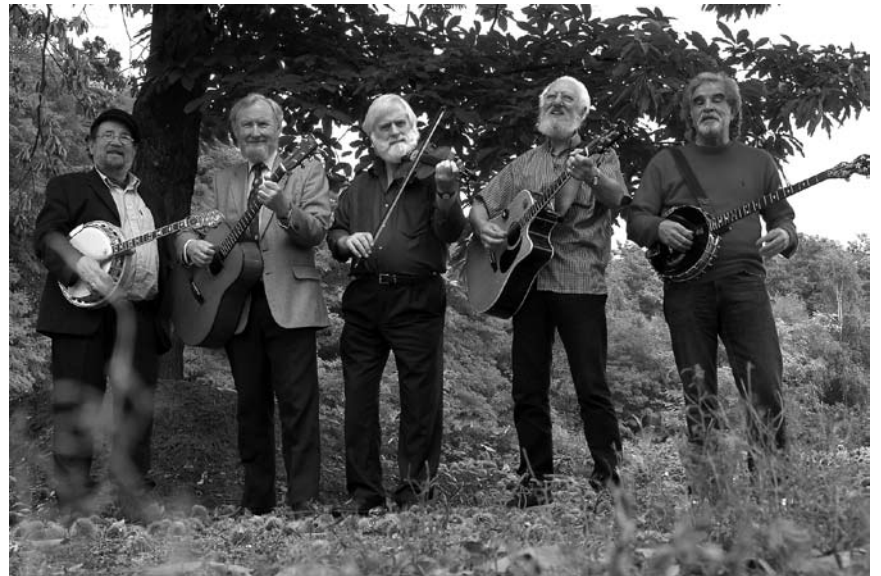
Verbreiten seit 45 Jahren irische Gemütlichkeit: und genau das haben sie auch an diesem Samstag dem 11. Oktober in der Sporthalle von Roodt-Syr vor.