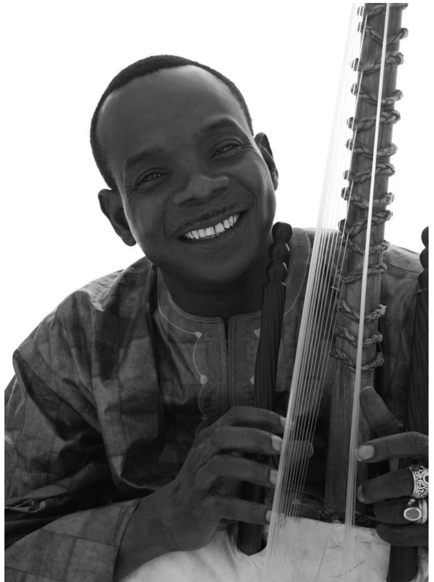
Ambassadeur international de la kora : sur invitation du Folk-Clupp Toumani Diabaté est au Mierscher Kulturhaus pour un concert unique ce vendredi 24 octobre.