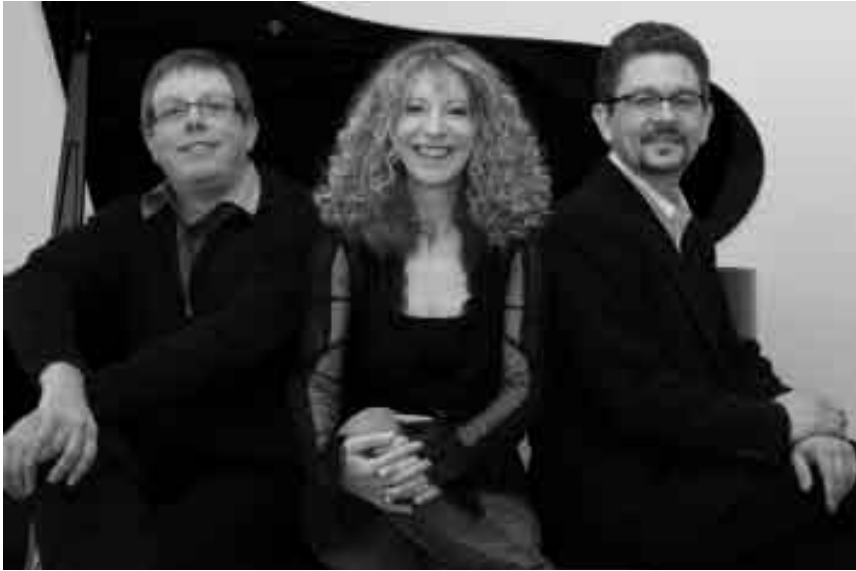
Im Centre des Arts pluriels in Ettelbrück feiert das Ensemble KML am Mittwoch dem 19. November Olivier Messiaens 100-jährigen Geburtstag.

Solidarité avec l'Amérique latine, hier et aujourd'hui , Galerie Terre Rouge, Esch, 19h. Dans le cadre de l'exposition « Dissidences autour de 1968 ».