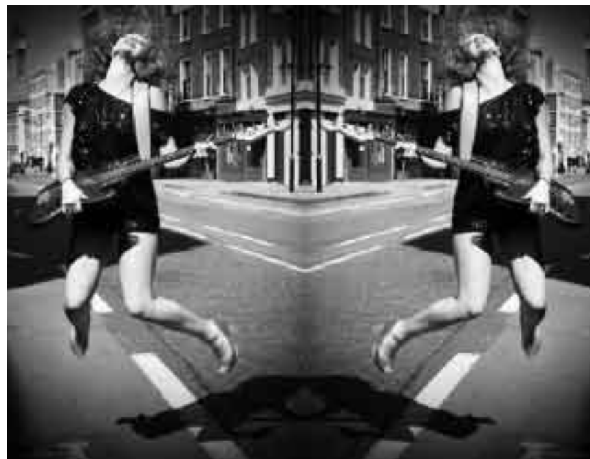
Es ist wieder Disco Bloen-Eck Revival Party-Zeit: Am Samstag, dem 22. November wird im Café Ancien Cinéma in Vianden gerockt was das Zeug hält.