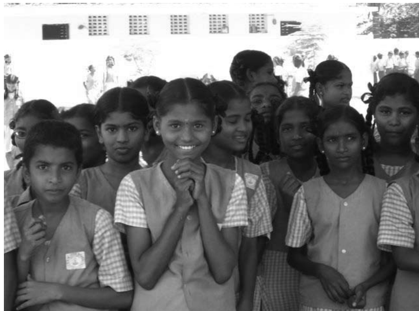
L'association d'aide au développement « Indesch Pateschaften asbl » organisera son grand bazar indien au Centre culturel de Bonnevoie ce dimanche 23 novembre.

32. Podium junger Künstler , Studierende der klassischen Musik der Conservatoires de Musique de Luxembourg et Metz, sowie Schülerinnen und Schüler von Mitgliedern des Philharmonischen Orchesters der Stadt Trier, Kurfürstliches Palais, Trier, 11h.