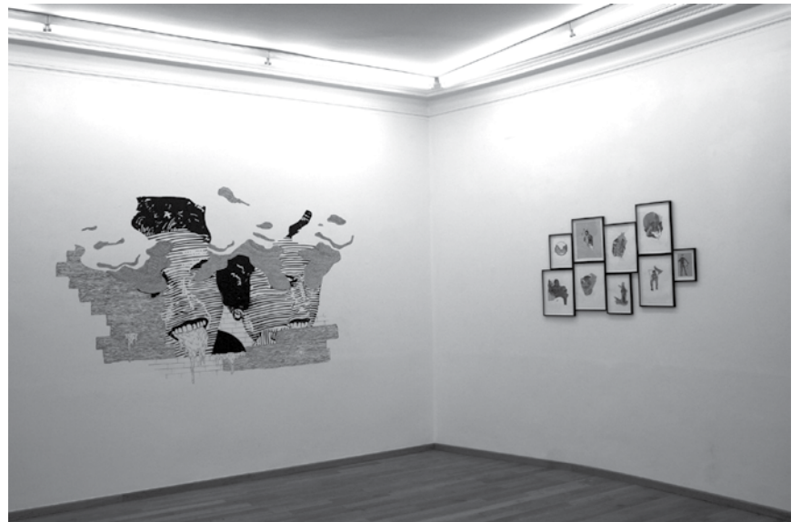
Les peintures et études de Manor Grunewald comprennent principalement des dessins et collages. Exposition jusqu'au 3 janvier à la galerie Nosbaum & Reding.