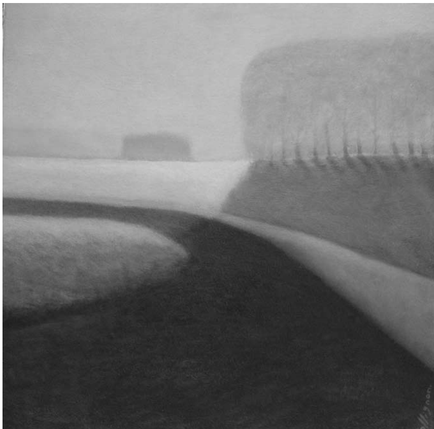
Approche pertinente et renouvelée du paysage, loin des harmonies conventionnelles : Dominique Collignon expose ses peintures à l'Espace Beau-Site à Arlon, jusqu'au 20 décembre