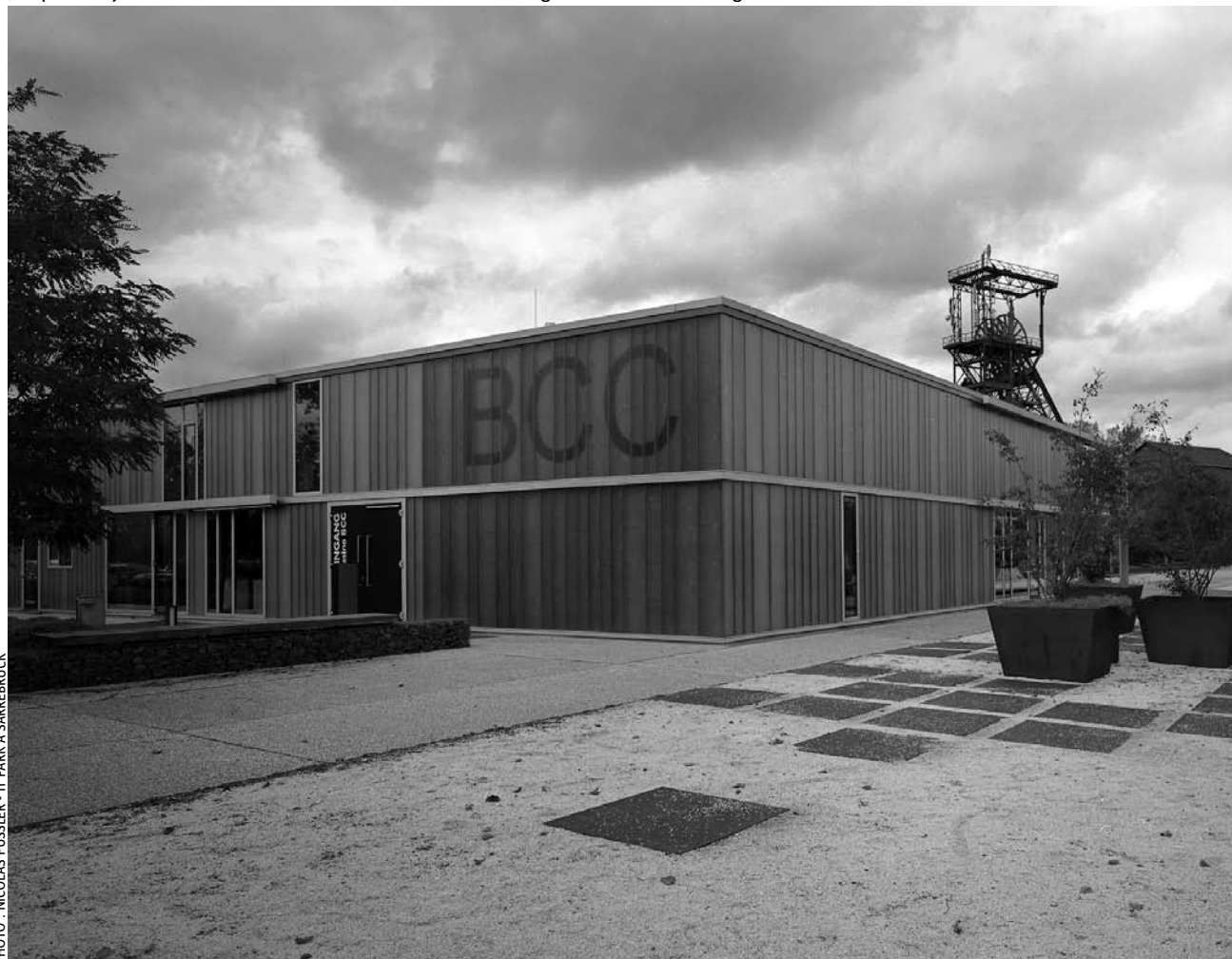
IT PARK A SARREBRÜCK

De l'habitat au lotissement, des zones commerciales aux centres villes, l'exposition photographique des paysages urbains contemporains transfrontaliers « Parallèle », croise le regard de trois photographes sur Thionville, Luxembourg, Sarrebruck, Belval ou le bassin de Longwy. Jusqu'au 17 janvier à la Fondation de l'Architecture et de l'Ingénierie à Luxembourg.