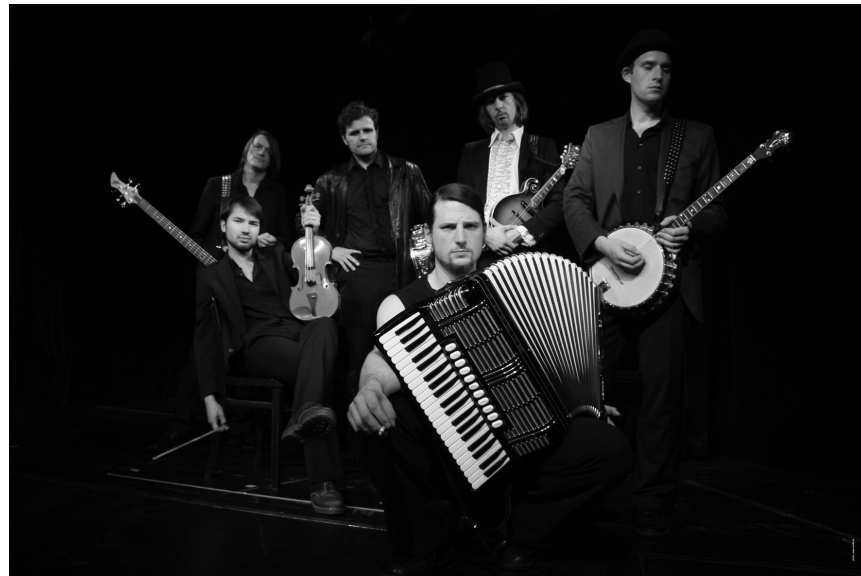
Dienstälteste Trierer Band: The Shanes geben an diesem Samstag dem 13. Dezember ihr Jahresabschlusskonzert im Exhaus.

Récital d'orgue, par Olivier Latry, au programme: Apparition de l'Eglise Eternelle et La Nativité de Messiaen, Cathédrale, Luxembourg, 20h.