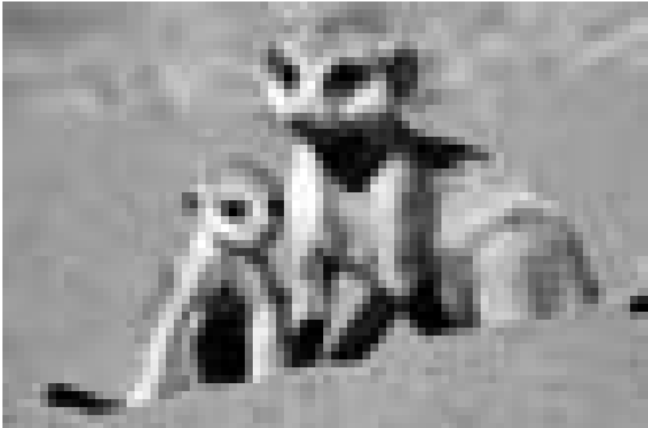
Les suricates, une espèce qui lutte pour survivre dans l'immense savane. « The Meerkats » documentaire de James Honeyborne. Nouveau à l'Utopia et Ciné Belval.