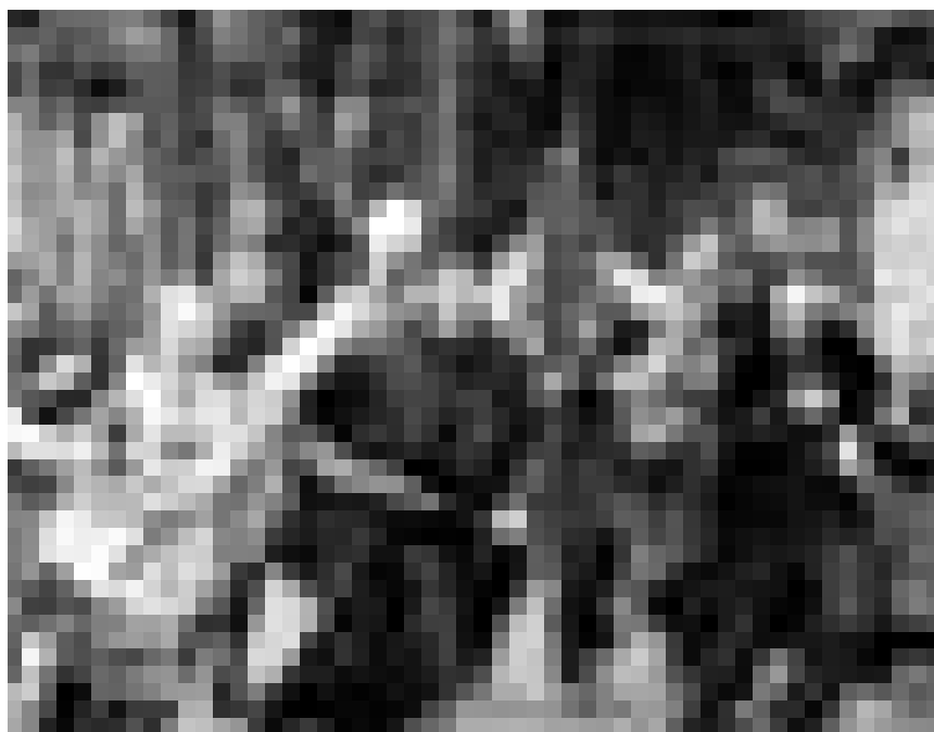
A Timpelbach, les enfants multiplient farces et mauvais coups. « Les enfants de Timpelbach » de Nicolas Bary. Nouveau à l'Utopolis.