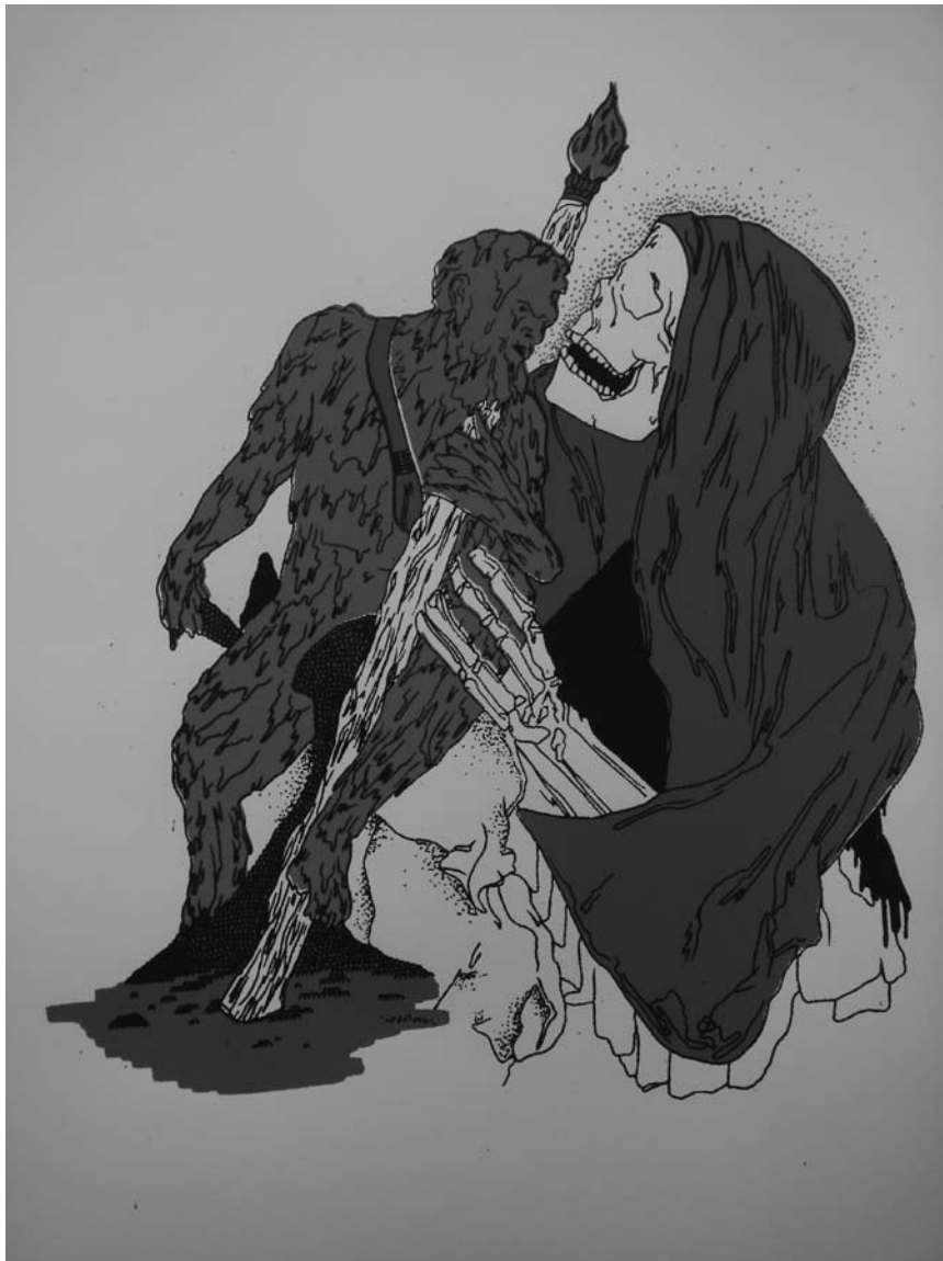
Der junge belgische Maler Manon Grunewald schiebt abstrakte Felder zu konkreten Bildern zusammen. Noch bis zum 3. Januar in der Galerie Nosbaum und Reding.