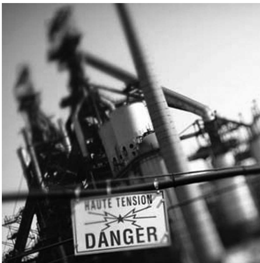
Marc Schmit expose ses photographies jusqu'au 15 février 2009 à l'Imprimerie Faber à Mersch.

peintures, photographies et sculptures en verre, Galerie Recto-Verso (9c, av. Dr Gaasch, tél. 26 50 28 95), jusqu'au 28.12, me. - di. 14h - 19h30.