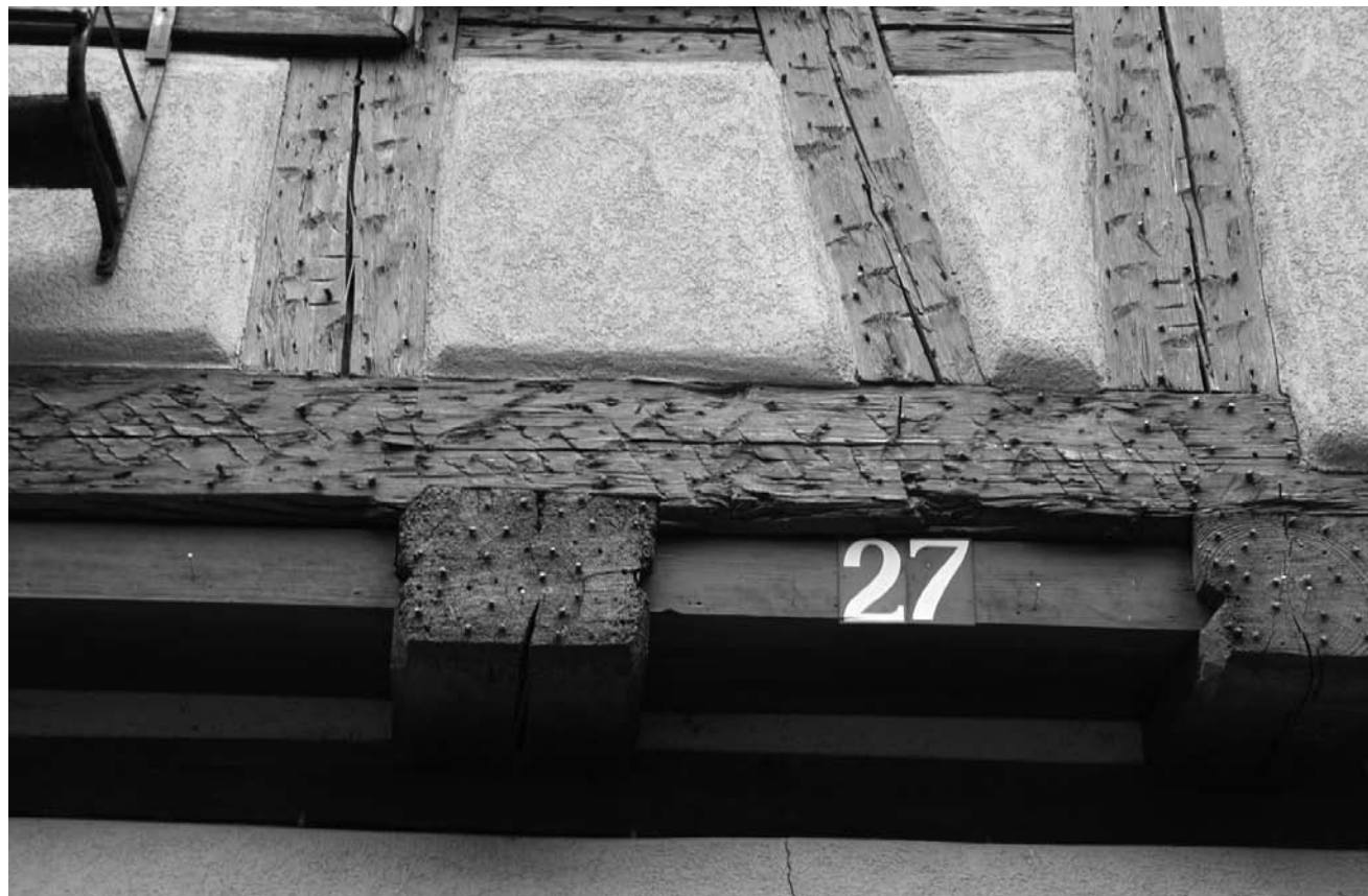
Détails curieux et matières entretenues : les photographies de Michel Poncin seront exposées à la Maison de la Culture d'Arlon jusqu'au 8 février.

« (...) à ne manquer sous aucun prétexte. Pas tant à cause de la qualité, mais pour l'ambition de réunir pour une fois celles et ceux