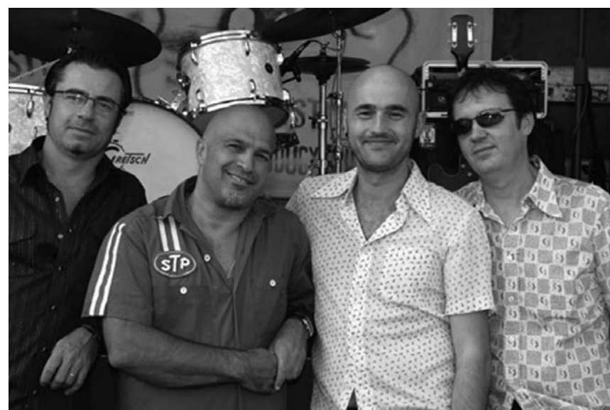
Avait déjà suscité l'enthousiasme lors du dernier Blues'n'Jazzrallye : Awek un des meilleurs groupes français de blues pour un concert solide au Sang a Klang le 16 janvier.

Toscane, un certain art de vivre , par Max Dauber, Conservatoire, Luxembourg, 20h. Dans le cadre d'Exploration du monde. Tél. 47 08 95-1.