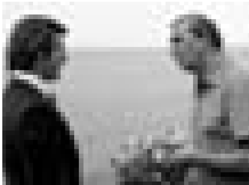
Richard Nixons Begegnung mit dem TV-Modertator David Frost. Michael Sheen und Frank Langella in „Frost/Nixon“. Neu im Utopia und im CinéBelval.

✘✘ Une histoire où même les pessimistes les plus endurcis y retrouvent le sourire peut taper sur les nerfs des uns ou enchanter les autres. A prendre ou à laisser. (lc)