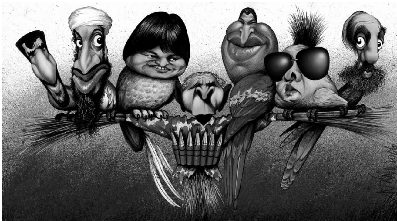
Antonio expose ses caricatures à connotation souvent politique encore jusqu'au 7 février au Centre des Arts pluriels d'Ettelbruck.

NEW Maison des Jeunes et église, du 31.1 au 13.2, tous les jours 14h - 18h.