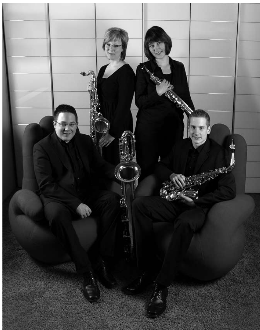
Ecouter pour mieux s'entendre : le quatuor de saxophones relance les concerts apéritifs du Mierscher Kulturhaus ce dimanche 25 janvier.

Négociations climatiques : quelle perspectives pour les pays en voie de développement , par Vincente Paolo Yu, Université du Luxembourg - Campus Limpertsberg, Luxembourg, 19h. Tél. 46 66 44-6563/6560.