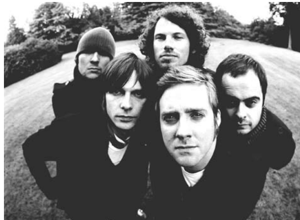
Ils sont fous ces Britanniques: Danananaykroyd et Kaiser Chiefs