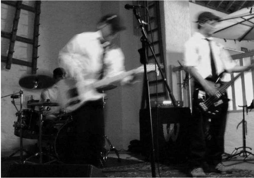
Le punkrock à la luxo version début 2009.