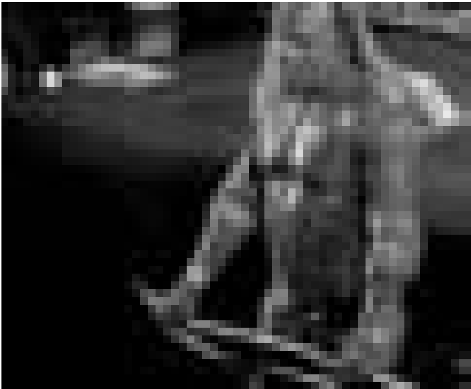
Das Ende eines Wrestlers: Glitter, Blut und Einsamkeit.