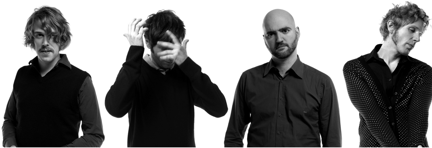
Elite de la pop luxo : Metro...