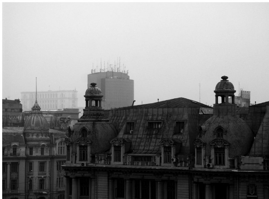
« L'évolution du paysage urbain et de l'espace public en Europe centrale et orientale », une exposition sur des villes tchèques, allemandes et sur Bucarest à lieu au CCRN.