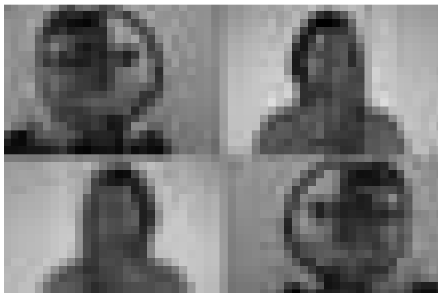
Ënnert dem Titel: Verschwommen, Verschwammen stellen d'Yvette Gastauer-Claire an d'Sol Wozniak an der Galerie vum Schlass zu Bourglënster aus.