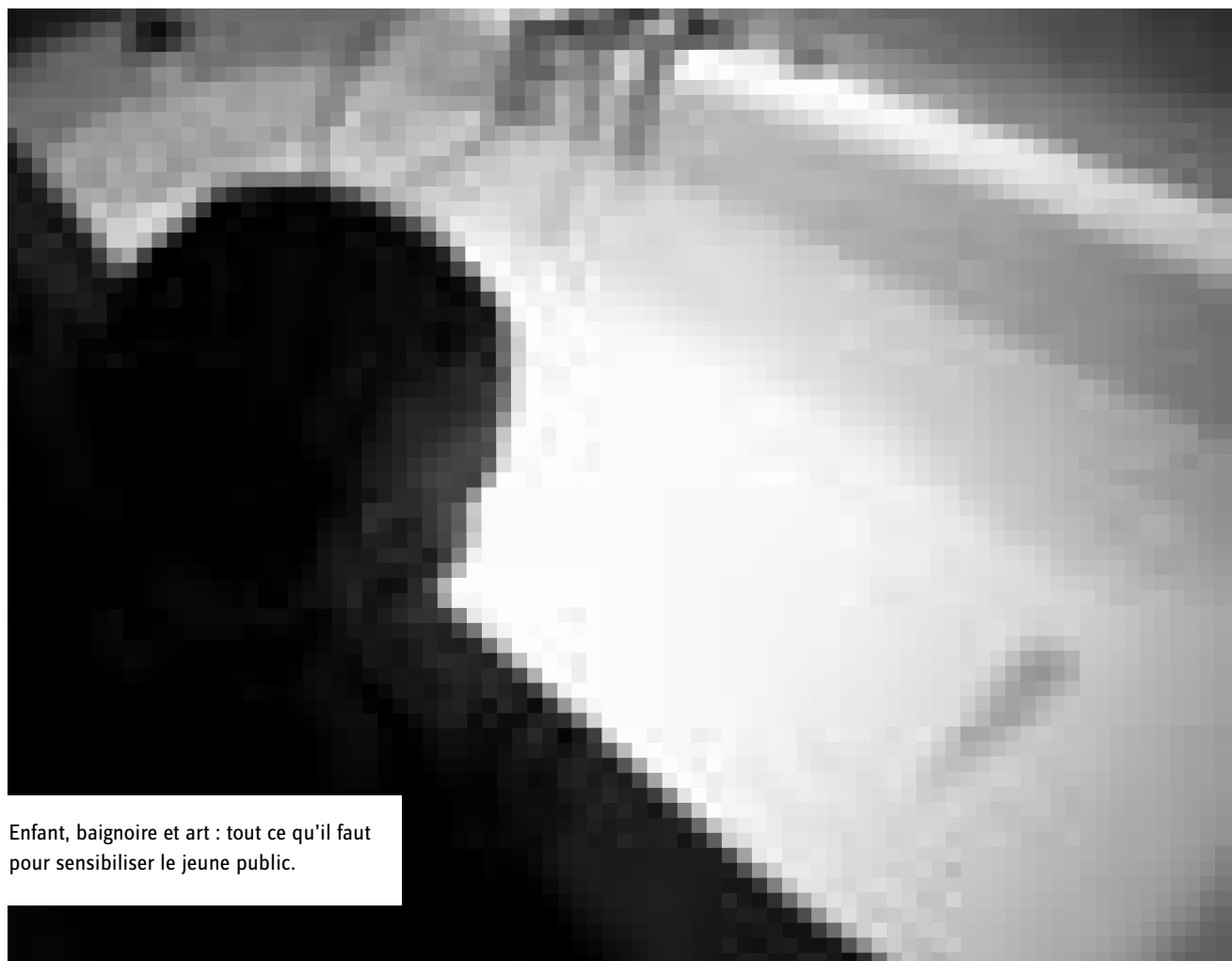
Enfant, baignoire et art : tout ce qu'il faut pour sensibiliser le jeune public.

çon originale. Cela paraît évident et pourtant le message n'est pas encore bien ancré dans la tête des gens. « Je comprends très bien qu'on en ait ras-le-bol d'entendre parler de protection de l'environnement, alors que pas grand chose se passe. IUEOA veut changer le discours sur l'écologie en lui apportant une touche artistique et ludique - tout en évitant de faire la morale. »