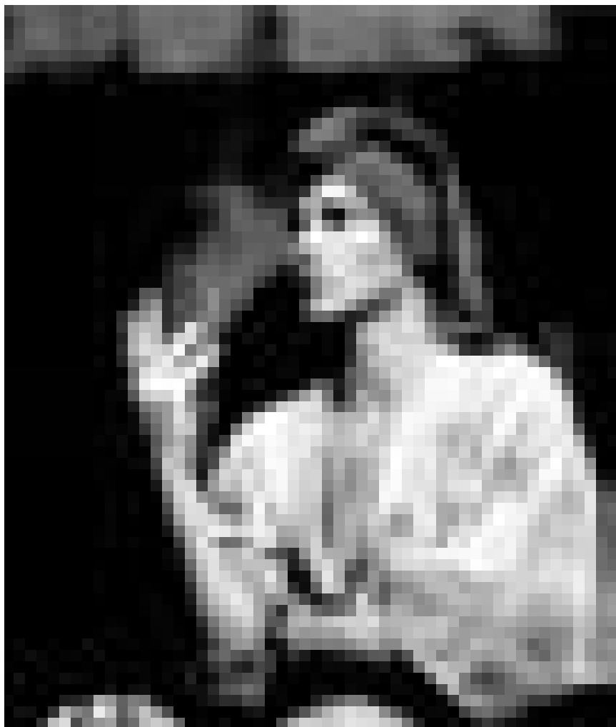
Dans une cellule de la prison d'une dictature d'Amérique latine ... William Hurt, dans « Kiss of the Spider Woman ». Vendredi à la Cinémathèque.