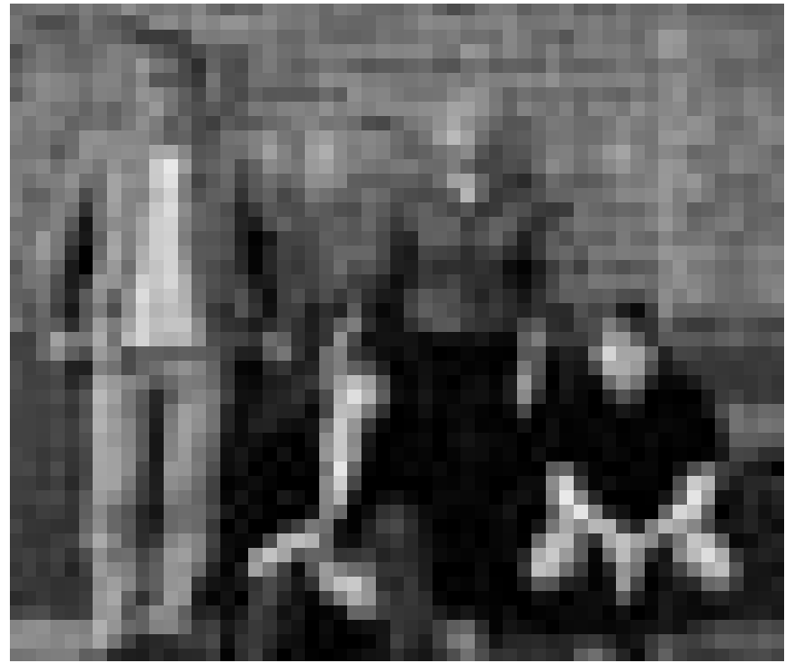
Machen seit 1980 Kunst aus Lärm : Sonic Youth, Noise-Legenden aus New York, mischen am 25. April das Atelier auf.

Choeur de jeunes transfrontalier Robert Schumann , jazz, Brasserie l'Abbaye (Centre culturel de rencontre Abbaye de Neumünster), Luxembourg, 11h30. Tél. 26 20 52 981.