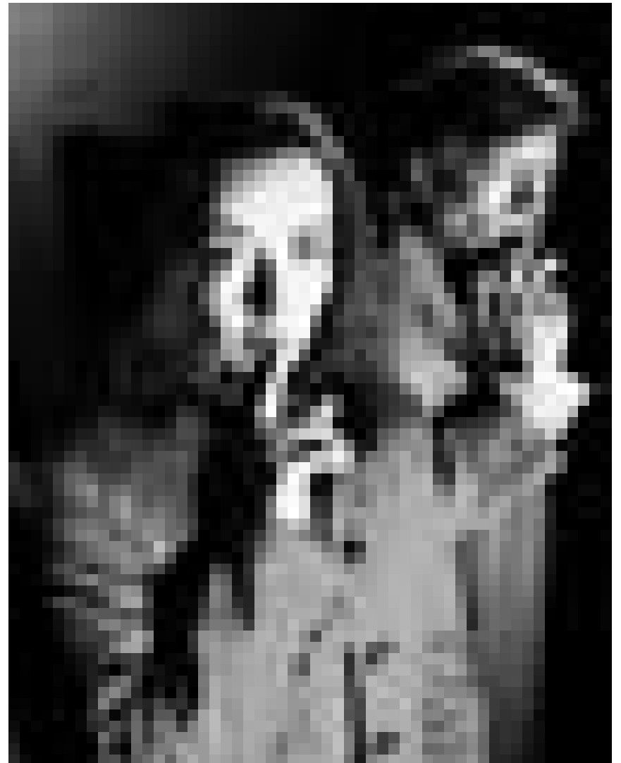
So hat man sie eigentlich am liebsten : Krieger im Gelee. Am 20., 21., 28., 29. und 30. April, jeweils um 20 Uhr im Kasemattentheater.

Lightnin' Bug , blues, The Liquid (15, rue Münster), Luxembourg, 21h30. Tél. 22 44 55.