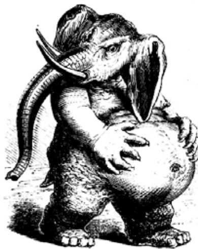
THE MAD ONES

Le Carnaval des animaux , théâtre musical et multimédia, Philharmonie, Espace découverte, Luxembourg, 17h . Tél. 26 32 26 32.