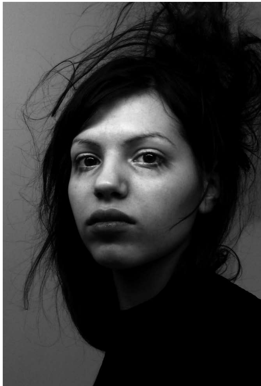
Jung, scheu, mit einem Hang zum Morbiden: Multitalent Soap & Skin kommt am 23. Mai für ein Konzert ins hauptstädtische Exit07.

Coquilles coquines , visite guidée de l'exposition, natur musée, Luxembourg , 16h (L). Tél. 46 22 30-1.