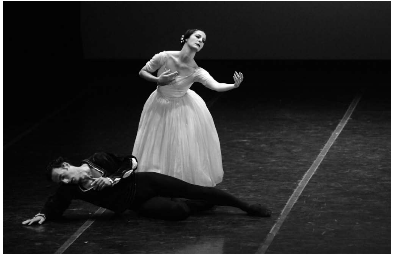
Un week-end romantique s'annonce ces 15, 16 et 17 mai à l'Opéra-Théâtre de Metz : «Giselle» , la légende populaire des Willis qui hantent la Forêt Noire, est l'un des ballets les plus joués au monde.

Einfach anrufen, am Montag zwischen 9 und 12 Uhr. Tel. 29 79 99-0.