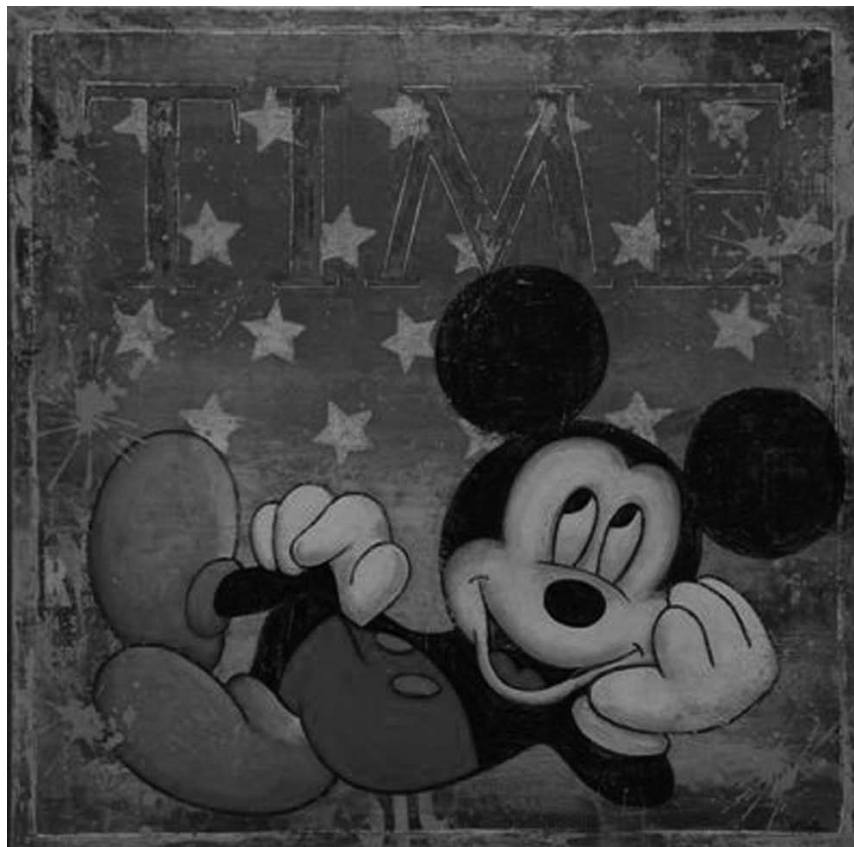
Le Pavillon du Parc Merveilleux montre les oeuvres sur toile du peintre belge Retsin jusqu'au 14 juillet.