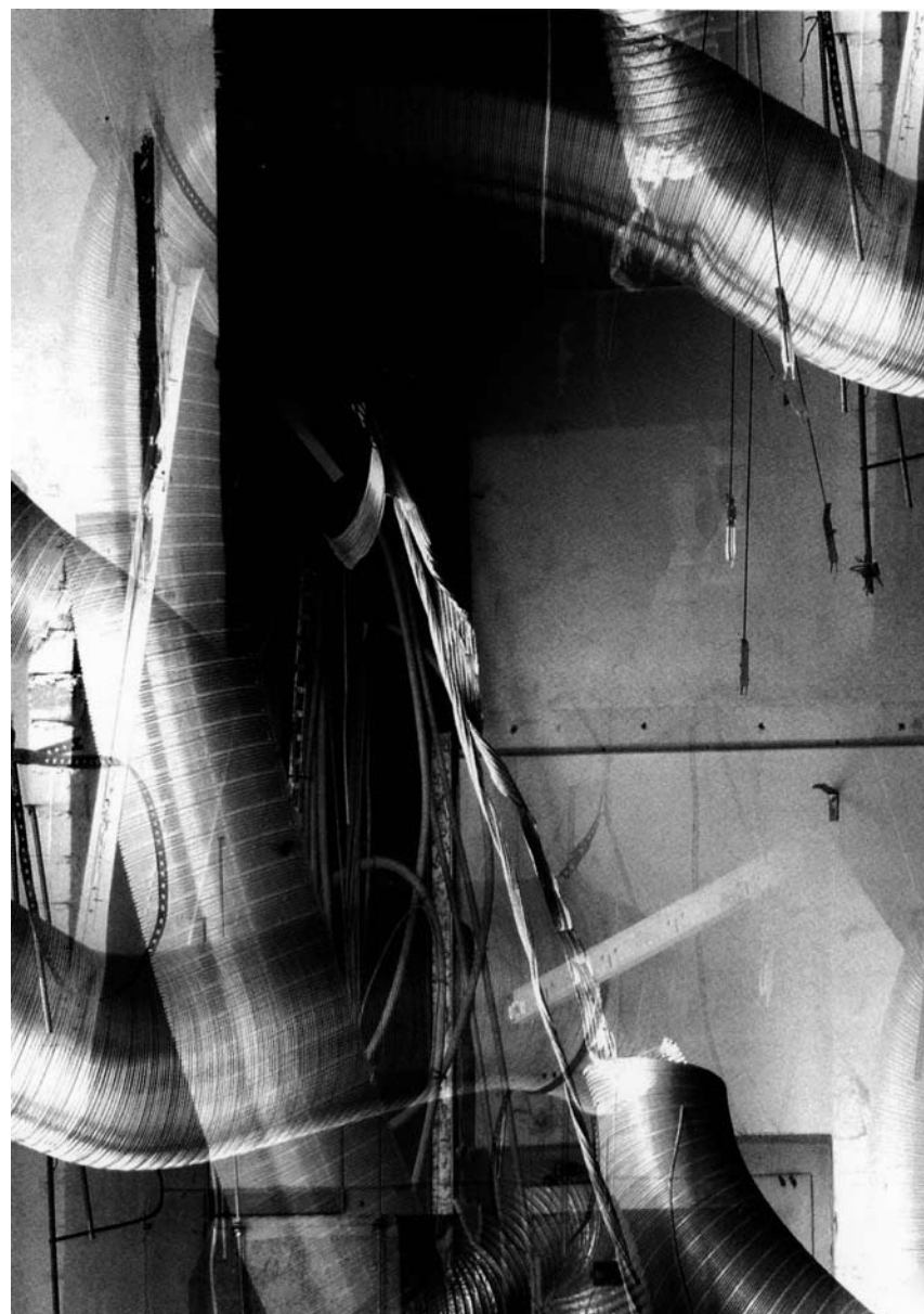
Les photographies de Serge Koch resteront accrochées au mur du siège du Crédit Suisse jusqu'au 17 septembre.

peintures, Galerie d'Art du château (tél. 95 74 44), jusqu'au 7.6, ve. 9h - 12h + 14h - 17h, sa. 10h - 12h.