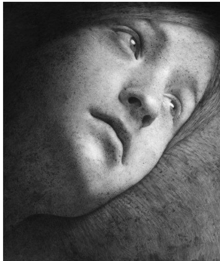
Les peintures de Michal Lukasiewicz sont à la La Galerie Schortgen jusqu'au 11 juin inclus.

Musée d'Art Moderne Grand-Duc Jean (Park Dräi Eechelen, tél. 45 37 85-1), jusqu'au 13.9, lu., je. - di. 11h - 18h, me. nocturne jusqu'à 20h.