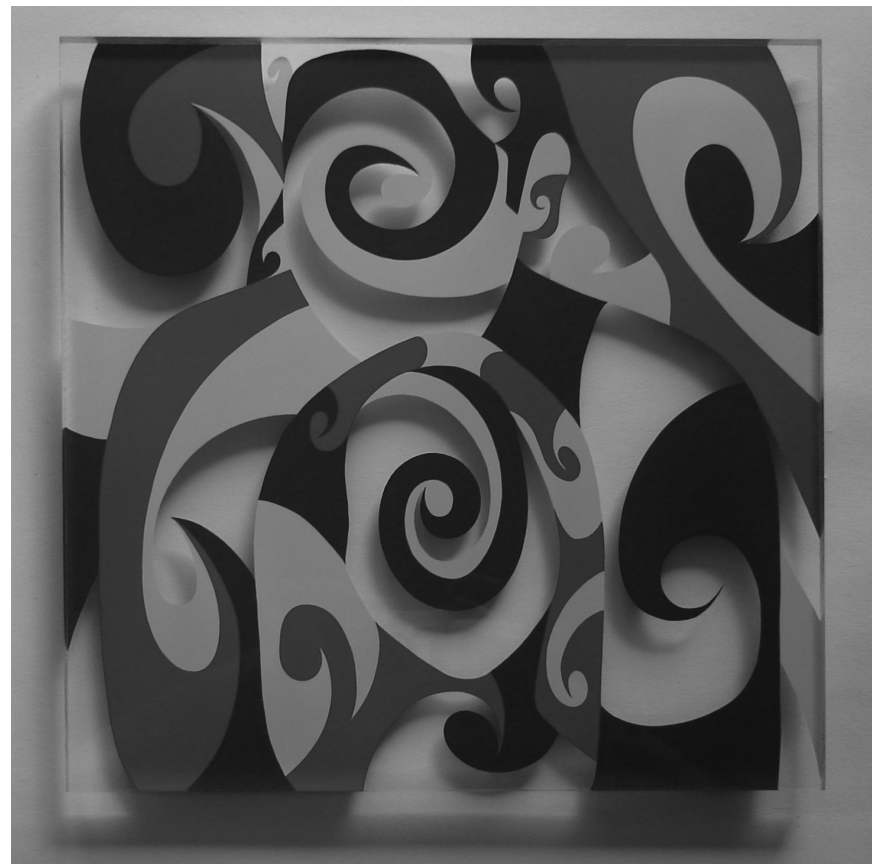
Adriana Woll stellt ihre Bilder im Juni in Saarbrücken und in Vianden aus.