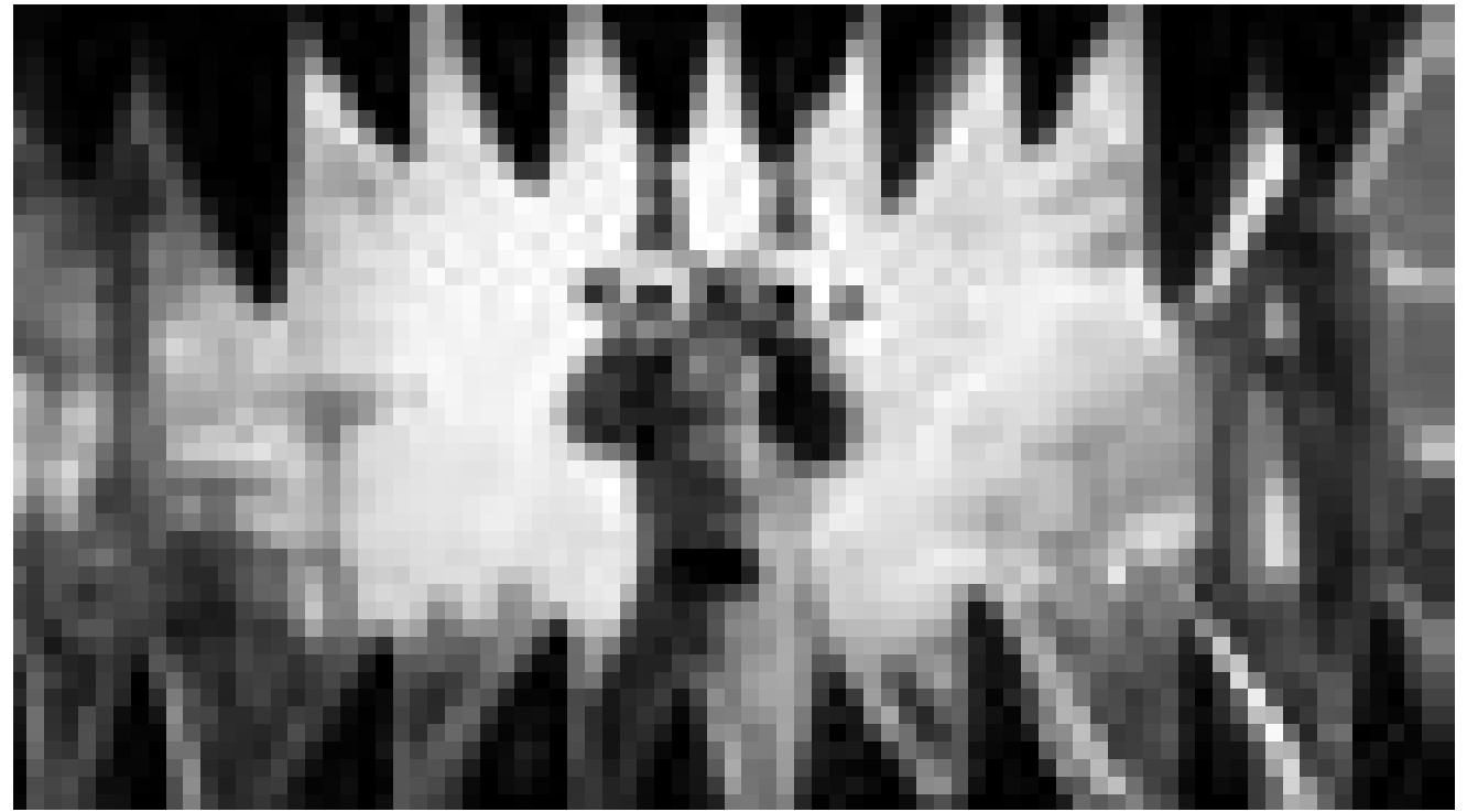
Wozu denn diese großen Zähne? Animationsfilm „Ice Age: Dawn of the Dinosaurs“. Neu im Utopolis, Ariston, CinéBelval und Kursaal.

Promi-Fotograf Connor Mead liebt seine Freiheit, seinen Spaß und die Frauen. Sein romantischer Bruder Paul dagegen will heiraten. Auf dem Polterabend ruiniert Connor mit seinem Spott über die Liebe die Stimmung. Doch dann taucht der Geist seines ver-