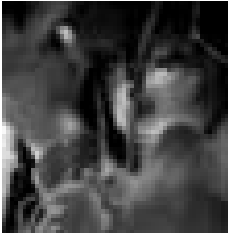
Flucht aus einem höllischen Gefangenenlager tief im undurchdringlichen Dschungel Vietnams. Christian Bale in „Rescue Dawn“. Cinédit im Utopia.