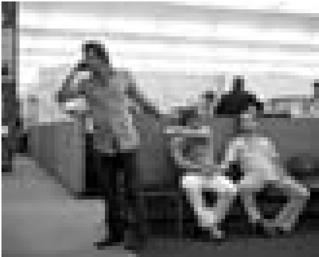
Am Morgen nach der Party ... Ed Helms, Zach Galifianakis und Bradley Cooper in „The Hangover“. Neu im Utopolis.