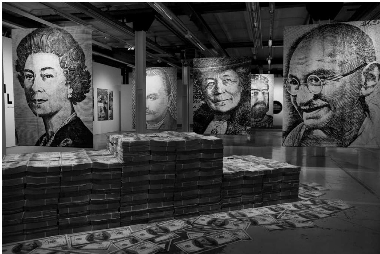
Letzte Gelegenheit: Nach vier Monaten schließt die Ausstellung Colors of Money an diesem Sonntagabend ihre Tore.

installations, Musée d'Art Moderne Grand-Duc Jean (Park Dräi Eechelen, tél. 45 37 85-1), jusqu'au 3.1.2010, lu., je. - di. 11h - 18h, me. nocturne jusqu'à 20h.