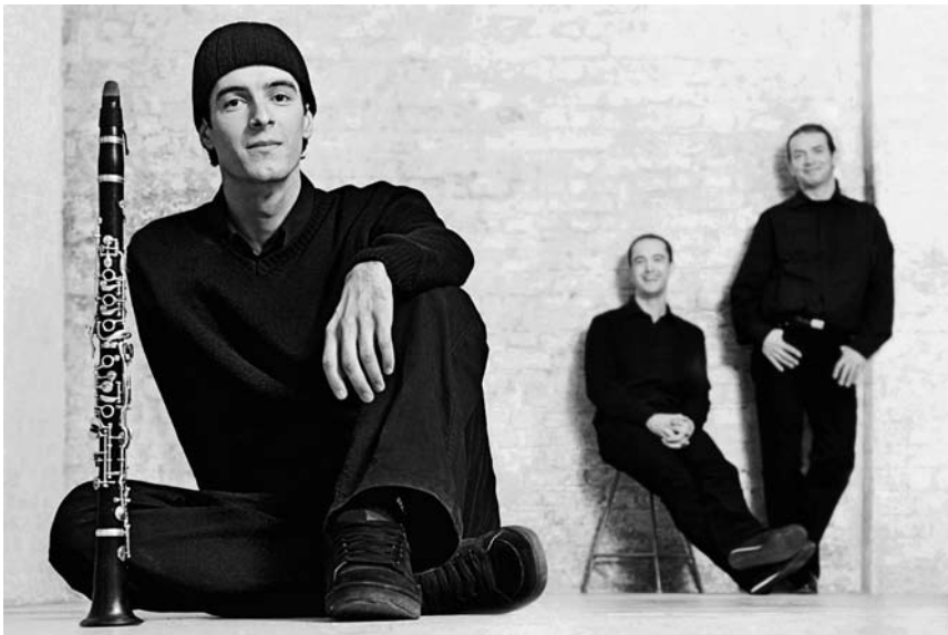
Zählt zu den außergewöhnlichsten Klarinettenisten seiner Generation und prägte den Begriff Weltkammermusik : David Orłowski spielt am 6. November im Cube 521 in Marnach.

Aufbegehren.de , Performance, Studio des Theaters, Trier , 22h. Tel. 0049 651 7 18 18 18.