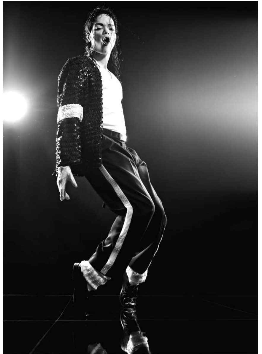
Die Jacksonmania schlägt an diesem Freitag, dem 30. Oktober hohe Wellen im kleinen Großherzogtum: Im Kino läuft der Dokumentarfilm an und in der Escher Rockhal kommt das Bühnenspektakel „King of Pop - The Show“ zum Einsatz.

The Age of Stupid , projection du film de Fanny Armstrong, Auberge de Jeunesse, Luxembourg , 19h.