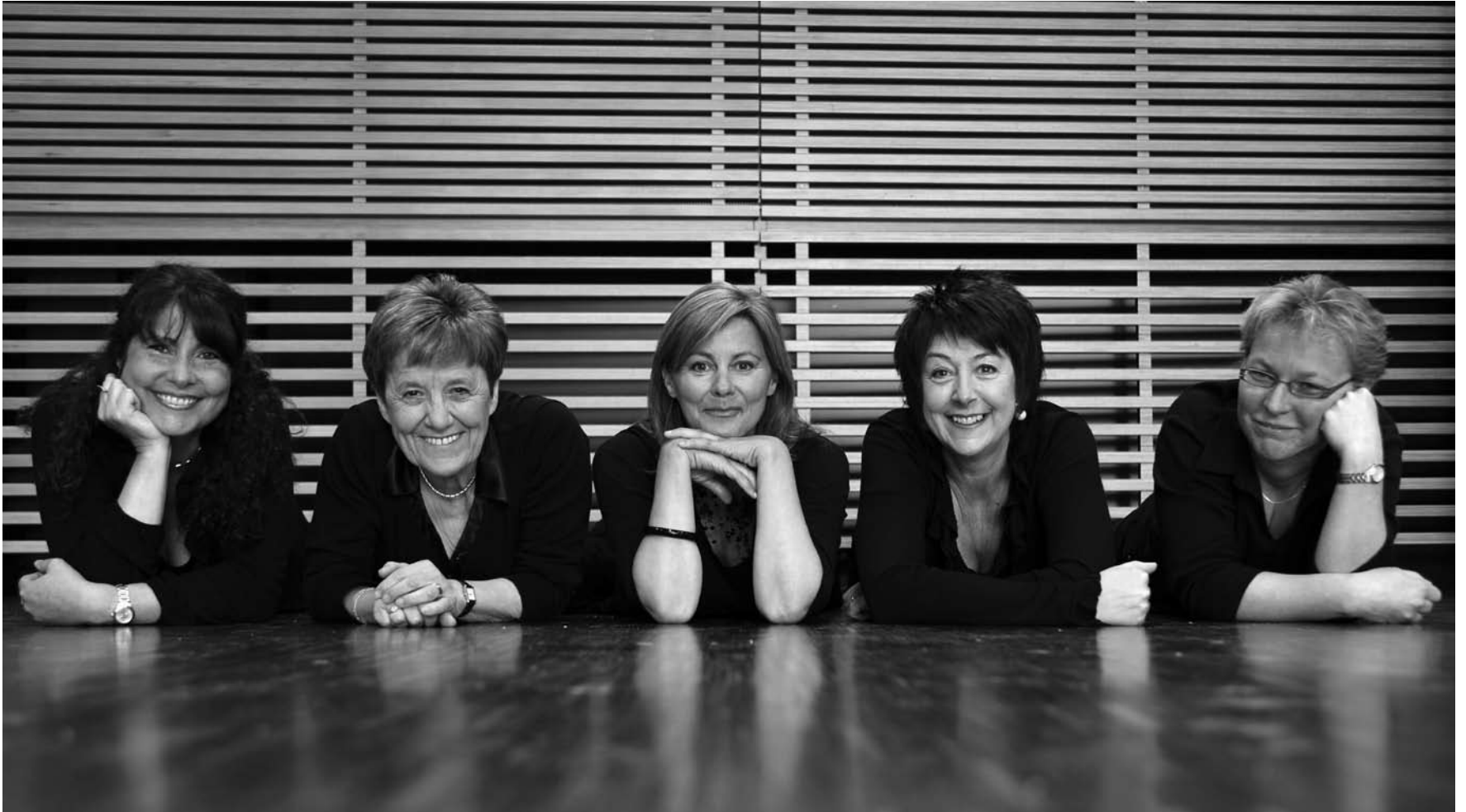
Verlangen resolut „Gëff dech!“: Die Makadammen geben an diesem Freitag, dem 30. und am Samstag, dem 31. Oktober im Mierscher Kulturhaus ihr neues Programm zum Besten.