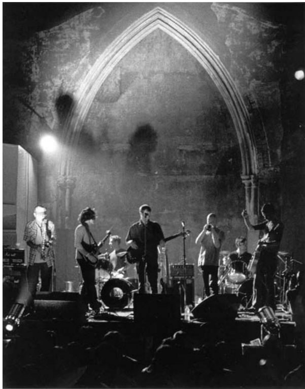
Ils n'ont pas inventé le fou rire sur scène : Do Make Say Think.