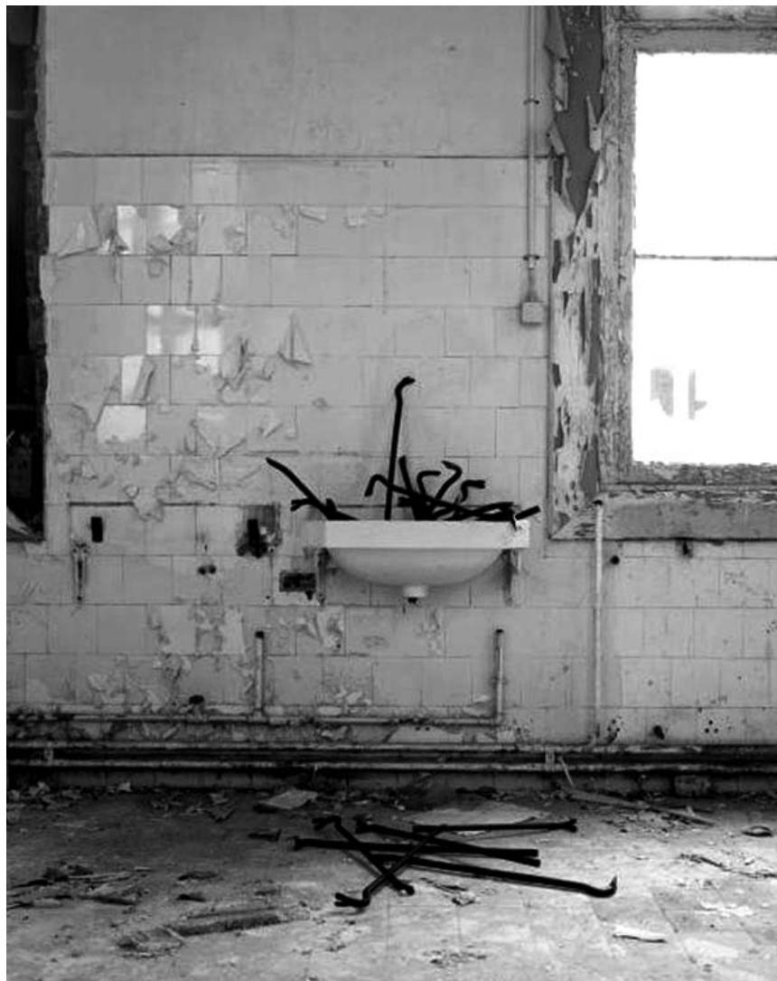
Le hype revient : The Plug s'expose à la galerie Nosbaum & Reding, jusqu'au 9 janvier 2010.