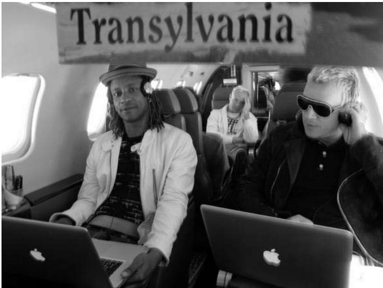
Auf das Äußere kommt es an – dagegen lassen die Texte von The Prodigy schon etwas zu wünschen übrig.