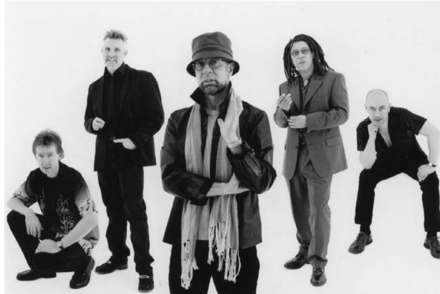
Manfred Mann's Earth Band kommt am 4. Dezember in die Eisenbahnhalle in Losheim, und wer sie da verpasst kann tags darauf nach Bitburg in die Stadthalle.

Kleeschengeschichte fir nozelauschteren , mam Roger Seimetz, Kulturfabrik, Esch, 20h. Tél. 55 44 93-1.