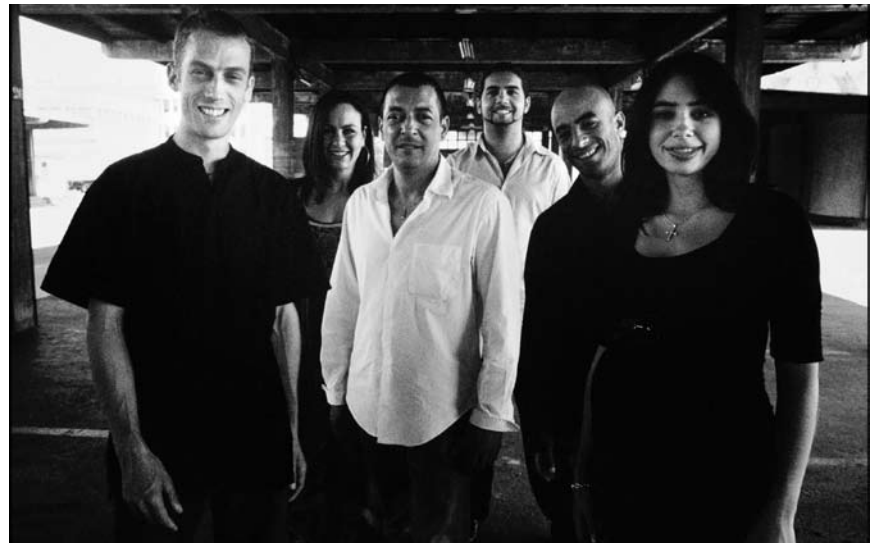
Rumba aus Katalanien präsentieren die MusikerInnen von Kaloomé an diesem Freitag, dem 27. November in der Escher Kulturfabrik.