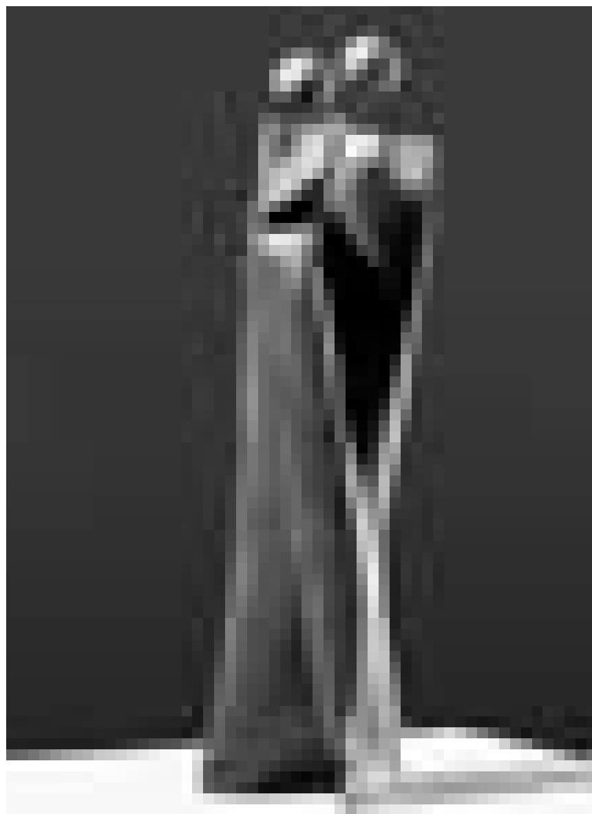
Les sculptures de Cathérine Maucourt seront exposées à la Galerie Recto-Verso à Rodange jusqu'au 27 décembre.

une exposition sur la vie - eine Ausstellung über das Leben, Musée d'Histoire de la Ville (14, rue du St-Esprit, tél. 47 96 45 00), jusqu'au 28.3.2010, ma., me., ve. - di. 10h - 18h, je. nocturne jusqu'à 20h.