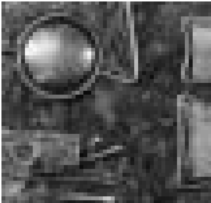
leurs bijoux et tableaux à la Galerie Armand Gaasch à Dudelange jusqu'au 20 décembre.

Bildenden Künste Saar, Saarbrücken, Cloître Lucien Wercollier im Kulturzentrum Abtei Neumünster (28, rue Münster, Tel. 26 20 52-1), bis zum 3.1.2010, täglich 11h - 18h.