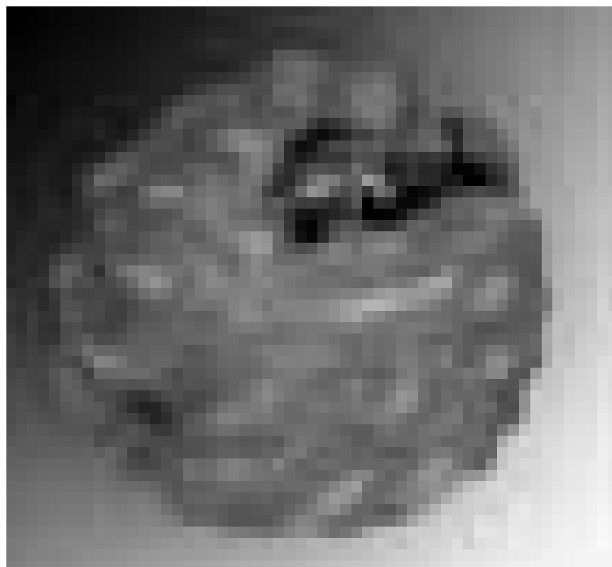
Christophe Nancey libère les richesses enchâssées : il expose ses sculptures à la Galleria Leukos de Bastogne jusqu'au 3 janvier.